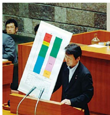
国の財政支出割合のボード