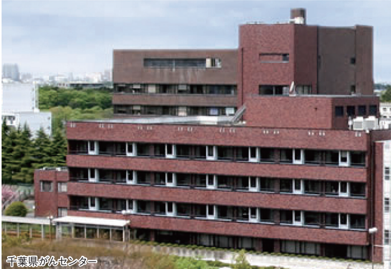
千葉県がんセンター