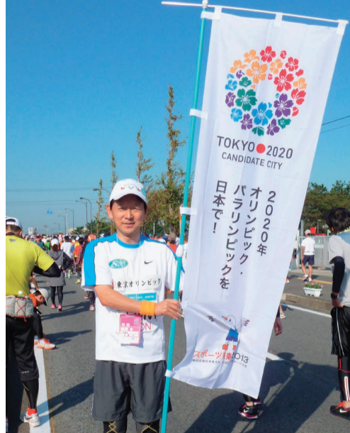
平成24年10月 ちばアクアラインマラソンでのオリンピックの招致運動

東京オリンピック・パラリンピックに係る県関係の予算が来年度予算で計上されました。会場の整備については、幕張メッセなどの大会開催に伴い前倒しで実施する施設整備等の改修を行います。また、大会を盛り上げるための聖火リレーや大会に併せたイベント等の予算も計上されました。もう1年半後となりました。東京で行われる大会であります。この大会は アクアラインを介せば東京に近い房総である 事を多くの人々に知って頂くチャンスであります。皆で努力をしましょう。