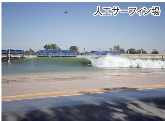
人工サーフィン場

木更津北インター(笹子)の近くで人工的に波を造るサーフィン専用のプール施設の建設が計画されております。