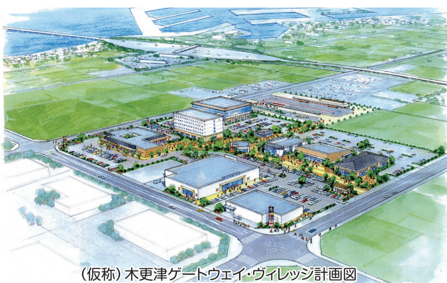
(仮称)木更津ゲートウェイ・ヴィレッジ計画図

金田西地区整理地内のバスターミナルに隣接する5万2408㎡の保留地を落札額22億円で(株)新昭和が落札されました。物販や宿泊など大小計9棟で構成する「(仮称)木更津ゲートウェイ・ヴィレッジ」を計画しており、物販は観光客向け地域物産店や地元住民向け商業施設など3棟、また医療・福祉施設2棟、宿泊・飲食を4棟設け、房総地域を周遊する観光客の拠点を目指す事としております。早期に事業着手をして頂き、房総全体への波及効果を広げて頂けたらと考えています。