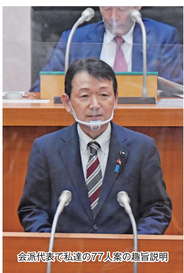
会派代表で私達の77人案の趣旨説明