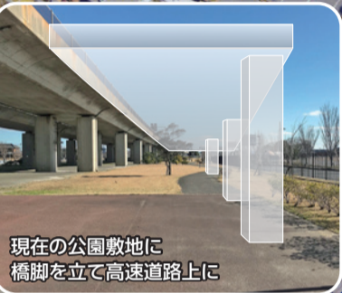
現在の公園敷地に橋脚を立て高速道路上に